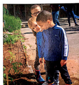
Jardinage, cirque, jeux... La MJC propose régulièrement des "temps partagés" entre adultes et parents.