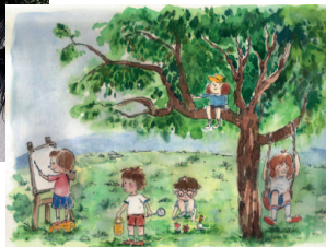
loïc Méhée, Véronique Chouvet & Pei-ju